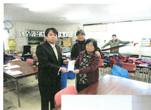
ありんこホームでの 寄付の様子←

皆様の善意で集まった浄財は、12月18日（月）に地域連合役員および地域労福協役員によって「ゆりかご園」「暁の星学園」「ありんこホーム」「恵明学園」「かもめの家」「城山学園」の6つの福祉施設へ寄贈いたしました。組合員の皆様、ご理解とご協力ありがとうございました。