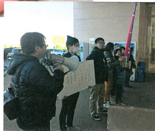
→シティーモールでの 街頭カンパの様子