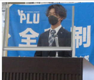
(右)上村中央ユースネットワーク議長

承認されました。 引き続き、議案書における第1号から第3号議案の提案がおこなわれ、満場一致で確認決定されました。 最後に、相田ユースネットワーク担当から新幹事が発表され、盛大のうちに閉会しました。